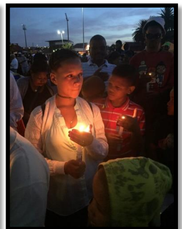
Een moment van herdenken