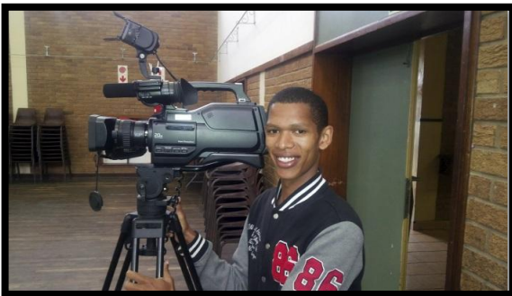
Eén van de studenten

In deze cursus leren studenten een film maken. Acht cursisten die deze cursus eerder al met succes hadden afgerond, mochten dit jaar op de Walter Sisulu University een erkende cursus tot scriptschrijven volgen. Endangered Species kreeg de kans om mee te doen met de Nelson Mandela Metro's "Township Film Factory". Zij trainden in twee maanden tijd meer dan 70 jongeren in het maken van een film.