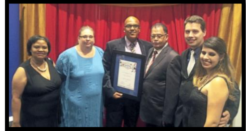
Bijna 'burger van het jaar'