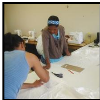
Uittekenen en knippen

In deze klas leren vrouwen en mannen kleding ontwerpen en maken. Dit jaar namen 9 personen deel aan deze cursus. Helaas is deze cursus gestopt, omdat de docent wegging. Op dit moment wordt gezocht naar een nieuwe docent.