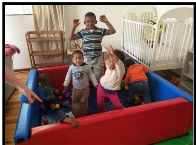
Plezier in de ballenbak

In 2015 kwamen achttien nieuwe kinderen onder de zorg van de Safe Haven. Hiervan wonen nu nog zes kinderen in de Safe Haven. Vier kinderen zijn terug naar hun ouders en acht kinderen zijn opgenomen in een pleeggezin.